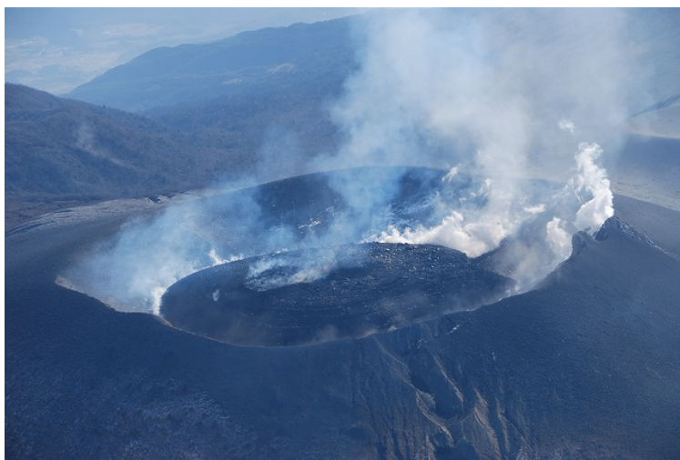
写真. ヘリから撮影した2月1日現在の火口内容岩