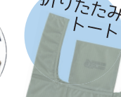
折りたたみトート