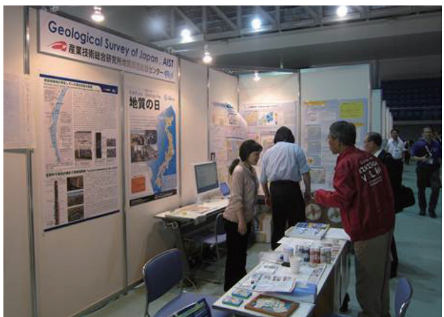
写真2 GSJブースの様子。