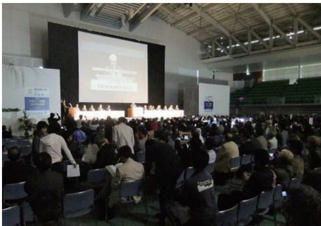
写真1 開会式の様子。

会議の最後に採択された大会宣言では、自然災害に人間がうまく対応するためにジオパークが大きな役割を果たすことが盛り込まれ、動く大地の国日本で行われた大会らしい宣言となりました。