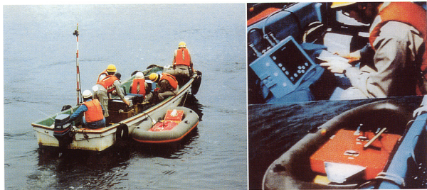
1. (左) 地中レーダによる水面からの測定状況。(右) 上: 測定器本体, 下: ゴムボートに設置した300MHzアンテナ。