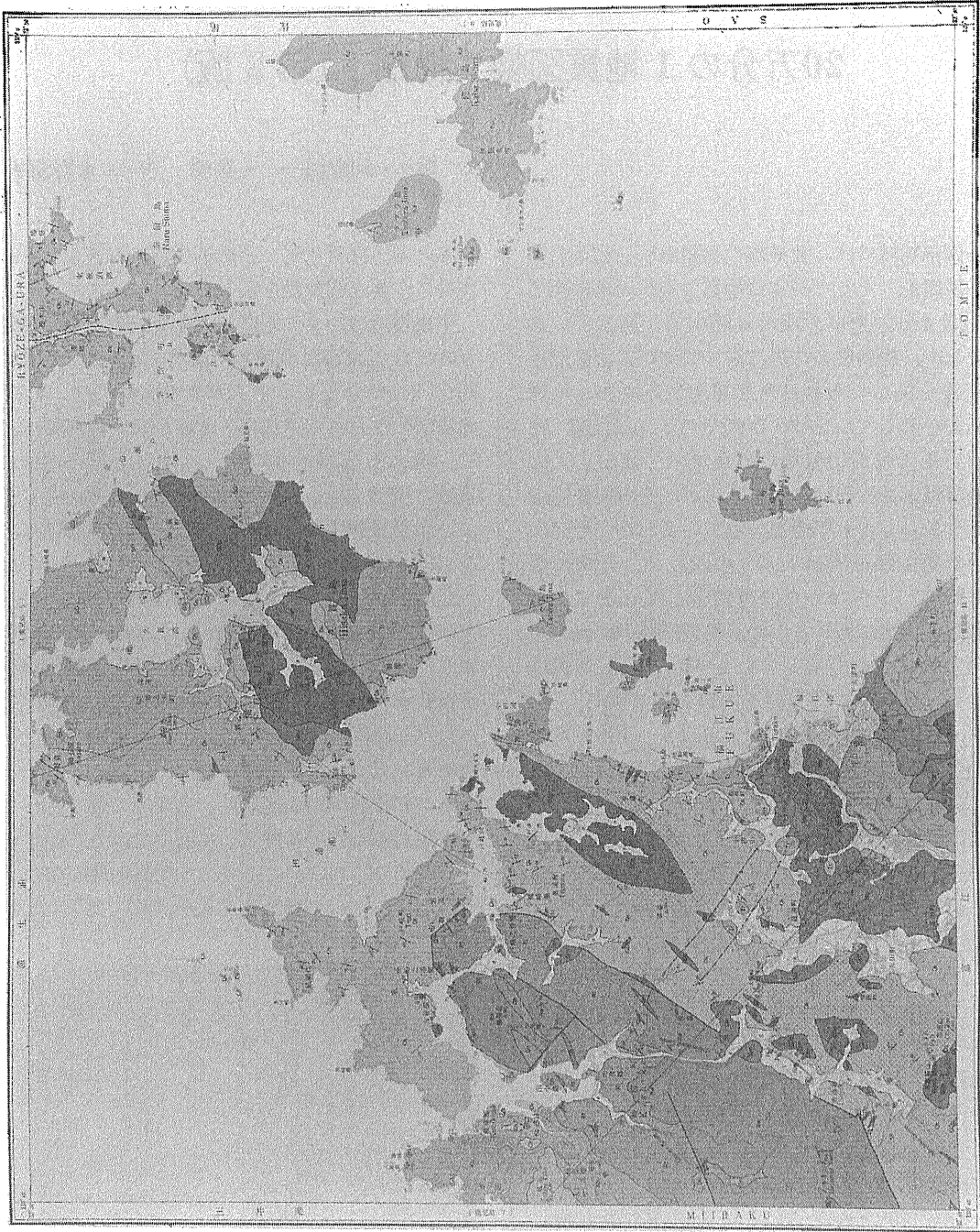
第2図 5万分の1地質図幅「福江」