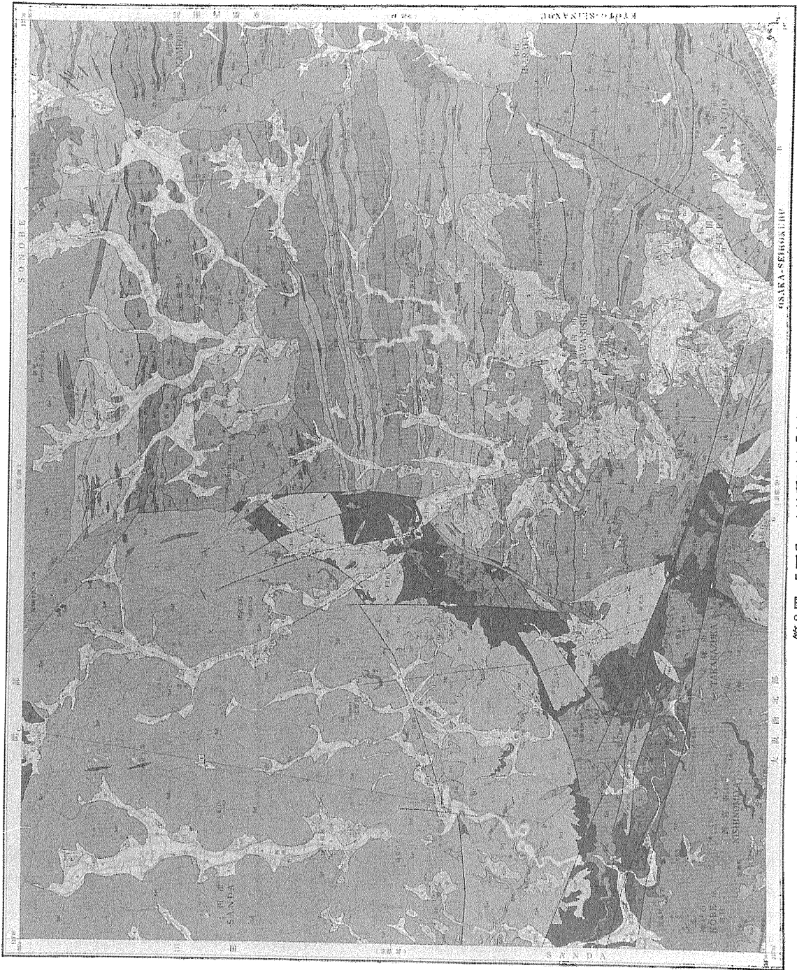
第2図 5万分の1地質図幅「広根」

なかった時期を示す陸成の堆積岩もあります。JR福知山線の神戸市道場駅から宝塚市僧川に至る地域では、これまでに二枚貝や松柏類の球顆の化石が発見されていますが、恐竜はまだ見つかっていません。有馬層群は白亜紀の地層なので、恐竜の化石も