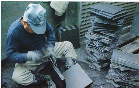
2. 切断後の薄板にする手割り作業。

登米粘板岩は現在、玄呂石と名付けられ、屋根材、床材、壁材のほか、花瓶、時計などにも加工されて、広く利用されている(写真2-5は東北天然スレート工業㈱作業場で撮影)。(工業技術院 石原舜三)