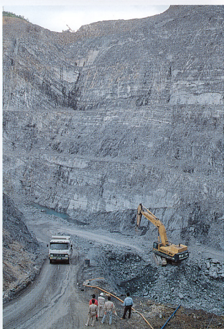
6. 登米粘板岩は骨材としても広く用いられており、その採石場はここに示す様に雄大である。