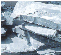
4. 採掘、搬出された原石。