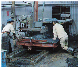
5. カッターによる原石切断。