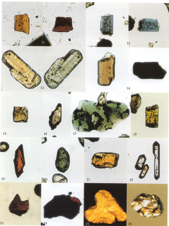
干渉色の著しい鉱物 1：普通輝石 2：黒雲石 3：クリノゾイサイト 4：タイアスポア 5：透輝石 6：普通角閃石 7：かんらん石 8：珪線石 9：透角閃石 10：ゾイサイト 多色性の強い鉱物 11：玄武角閃石 12：藍閃石 13：紫輝石 14：電気石 特有の色調を持つ鉱物 15：褐れん石 16：錫石 17：緑泥石 18：緑れん石 19：金紅石 20：スピネル 21：十字石 22：ジルコン 通常は不透明であるが粒子の薄い部分で光を通す鉱物 23：クロム鉄鉱 24：赤鉄鉱 反射光でみた不透明鉱物 25：金 26：チタン鉄鉱