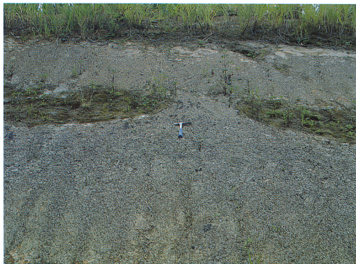
↑写真3 写真2のシルト層はさらに左方に連続し ほぼ等間隔に分断されている。分断された部分では 下方より破砕されたシルト層がストック状に上に突き上げている。