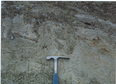
↑写真5 露頭の右方では 細かいラミナをもつシルト層が激しく層内褶曲をおこしている。これは 地層が堆積後に流動化し 小規模なスランプが発生したものと考えられる。

断層の近傍では 地層は引きずられて直立している。写真では 段丘堆植物（礫層）と魚沼層群との不整合面（ハンマーから下方）が直立し 断層で切られている。