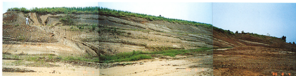
↑写真1 親沢断層の露頭全景。断層は人の立っているところを通過して 左上から右下へのびている。露頭上部は人工的に削平されているが 左側の段丘堆積物の連続が本来のついていたものと考えられる。写真手前には断層のさらに下部が露出し 魚沼層群に複雑な変形を与えている。

この断層は魚沼層群の堆積直後より活動しているものと推定できる。周辺の地形をみると 上下3段の段丘面が 高位の段丘面ほど大きく断層変位をうけてくずれ込んでおり この断層は第四紀後半に繰り返し活動している活断層であることがわかる。