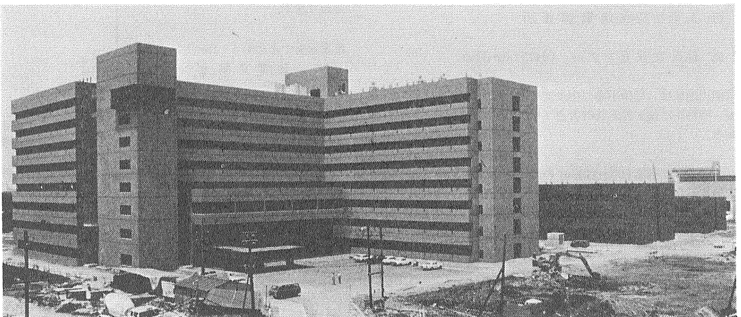
完成した地質調査所本館と(右)別棟