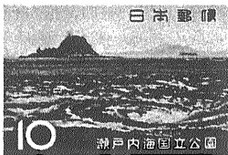
瀬戸内海 国立公園