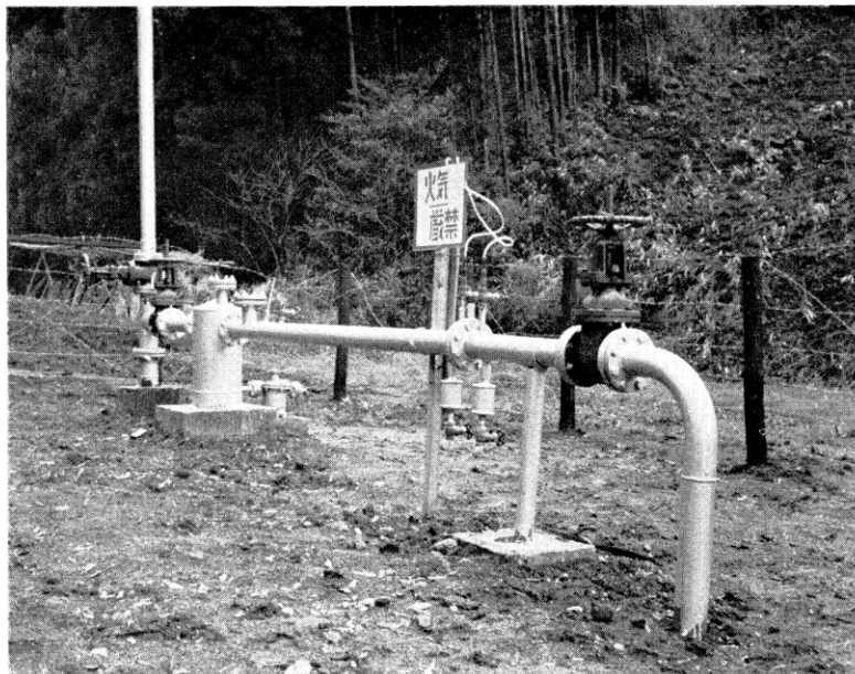
炭田ガス掘り抜き井