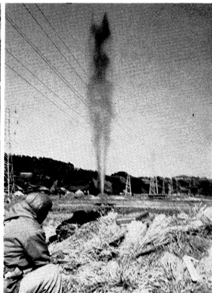
地震探査（爆発の瞬間）