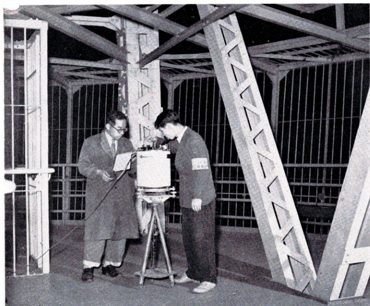
陸上重力探査（東京タワー塔上にて）

また ウラン鉱床として開発中の人形峠地域においては 最近 地震探査・電気探査によって 鉱床の探鉱に役立っている。