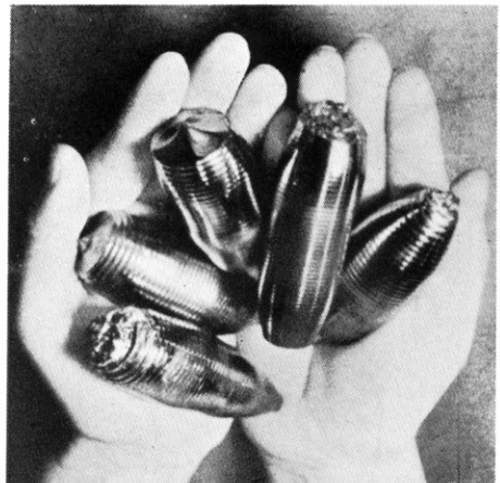
シリコン単結晶 (純度99.99%)