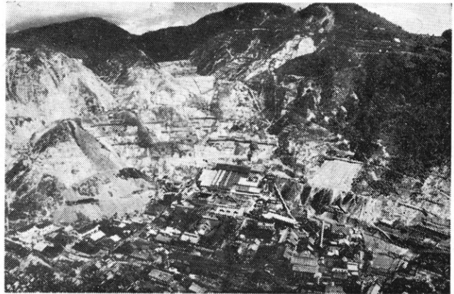
鹿間工場全景および枋洞選鉱場の一部