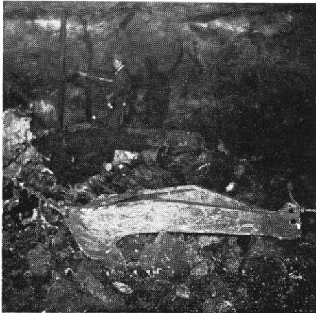
切羽におけるスクレーパーの活動