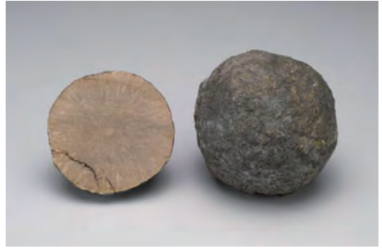
写真5 標本館所蔵(登録番号 GSJM 33899).