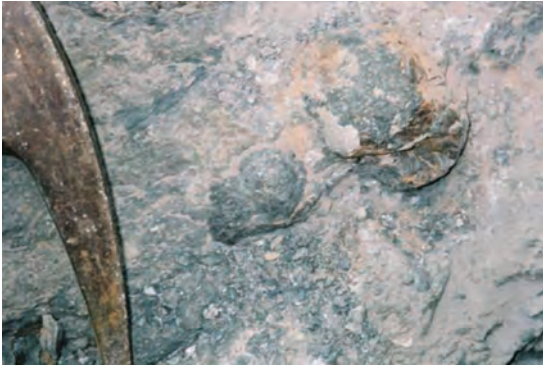
写真4 下部砂岩層におけるノジュールの産状.