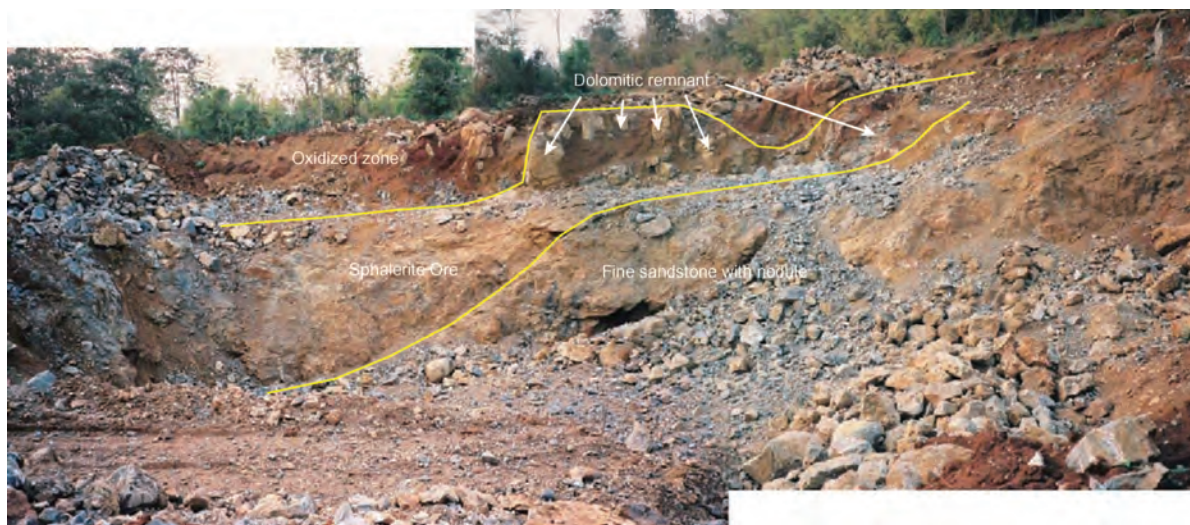
写真1 Tak Mining社 Pha Det I 鉱体の切羽状況(1998年1月当時).