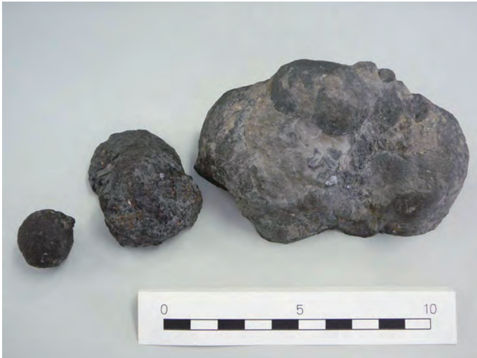
写真6 様々な大きさの閃亜鉛鉱ノジュールの外形.