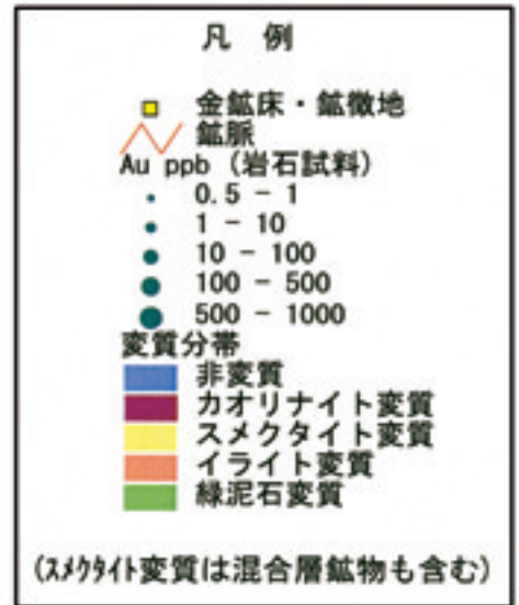
串木野鉱床地区 (A) と菱刈鉱床地区 (B) の変質と岩石の金含有量の比較図。 広域調査データベースについての説明は、本文63頁囲み記事を参照されたい。