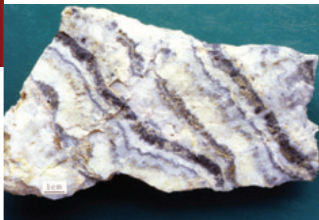
3. 大口金山3号脈5坑道の金銀鉱石. 白色部は石英. 灰黒色部は銀黒で, エレクトラム(金銀合金鉱物)や, 銀, 銅, 鉄などの金属の硫化鉱物が含まれる. 池田富男氏の標本.