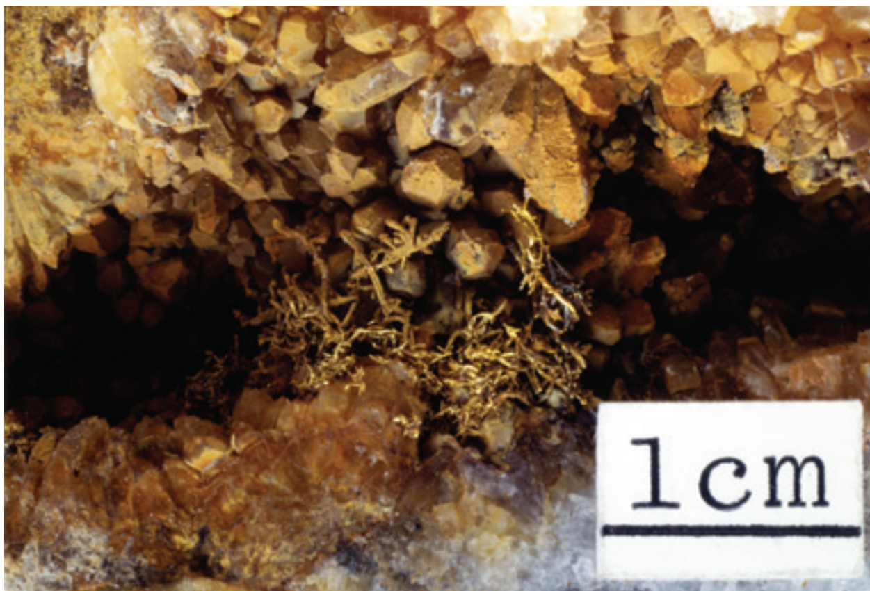
1. 山ヶ野金山の糸状の金(エレクトラム, 金銀合金鉱物). 周りは石英(水晶). 明治後期に採取された. 尚古集成館の標本.