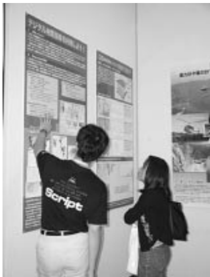
写真1 デジタル地質情報を利用しようのコーナーにて展示の説明。

BMP (Bitmap), TIFF (Tagged File Format) など ・マルチメディアデータ：BMP, WAV, AVI