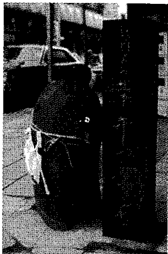
写真7 長野県松本市 本町通りにあ る牛繋ぎ石。

「グリーンタフ」です。この他県内各地にあり、例えば松本市内本町通りの中ほどにもしめ飾りをかけられた「牛繋ぎ石」が保存されています(写真7)。