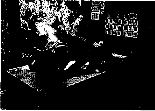
写真5 錦天満宮境内のブロンズ製の臥牛像(京都)。