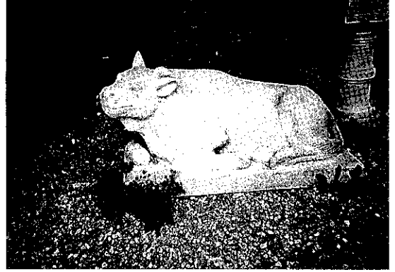
写真4 布引観音境内にある人工の臥牛石。

この参道沿いに観光地点を示す立札の掲示があり、その中に「馬岩」と称する部分があります。これはあとで紹介します。その先に「牛岩」という掲示