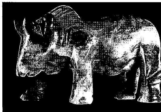
写真1 インダス文明を象徴するコブ牛の彫刻(オニキス製、複製品)。

ありえないことの例えとして『烏頭白くして馬角を生ず』という言い回しがあります。その奇跡的なことが起こったという故事が中国の有名な古典の1