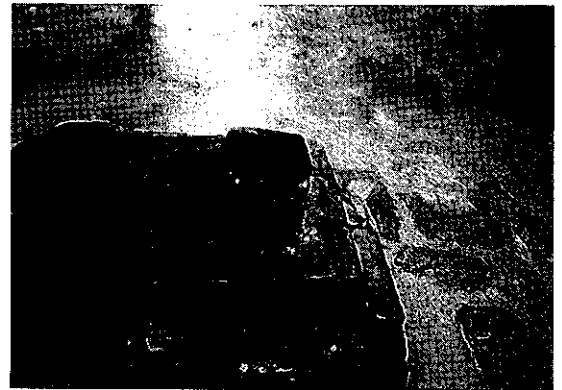
写真6 パンティヤイ・スレイ(カンボジア)にある聖牛ナンディンの臥牛石。

(五来, 1988)。本来は善光寺講の一団を引き連れて善光寺詣りをする先達を「御師」と呼んでいたもので、この時先達が一本の白い布の綱(善の綱)を持って信者の列を引っ張っている事例があるといわれています。これが後世になって牛に戯画化されたのではないかというのです。