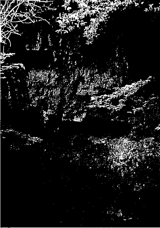
写真3 牛岩(長野県)。布引層の凝灰角礫岩の露頭の表面に牛の形が見えるというが？

の観音堂は、本堂の西側に、断崖にぴったり張りつくように造られ、桁行五間、梁間五間半、入母屋破風造、銅板葺き、朱塗りで、外陣は20m以上もの8本の長い柱に支えられた舞台造りで、京都の清水寺の懸崖造りとはいきませんが、一見の価値がある立派なものです。鎌倉時代の代表的建築として国指定の重要文化財となっています。