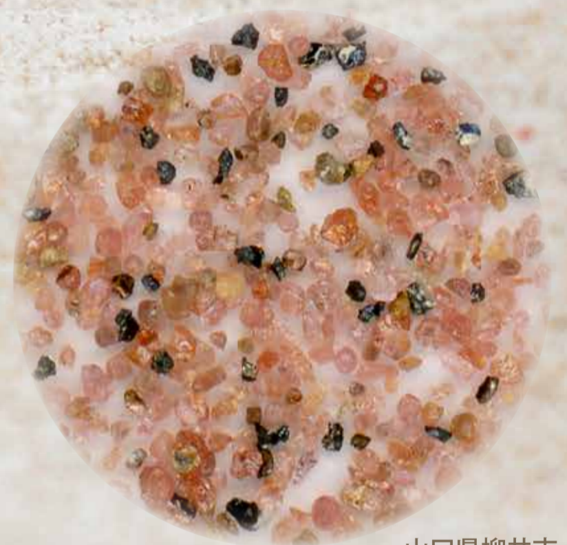
山口県柳井市 阿月浜の砂