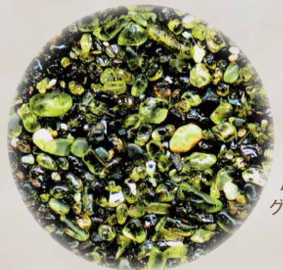
ハワイ島 グリーン・ビーチの砂