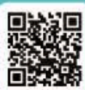
地質試料調製 グループ ウェブサイト