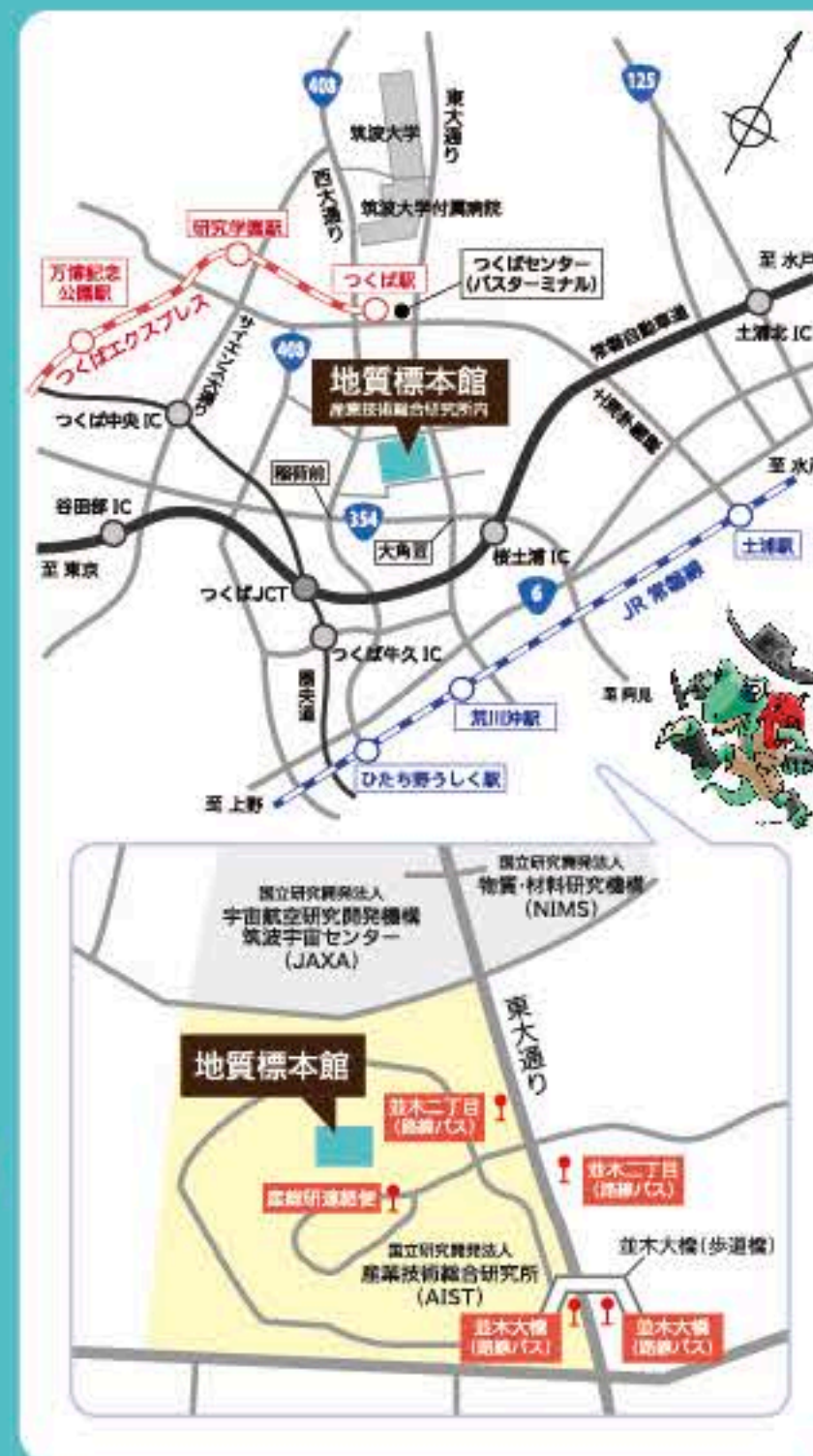
国立研究開発法人 産業技術総合研究所 地質調査総合センター 地質標本館