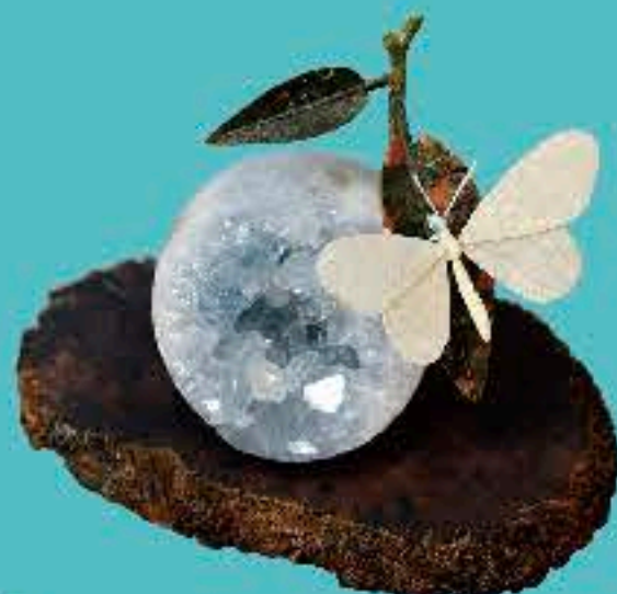
薄片技術で作られた ヒメシロチョウ