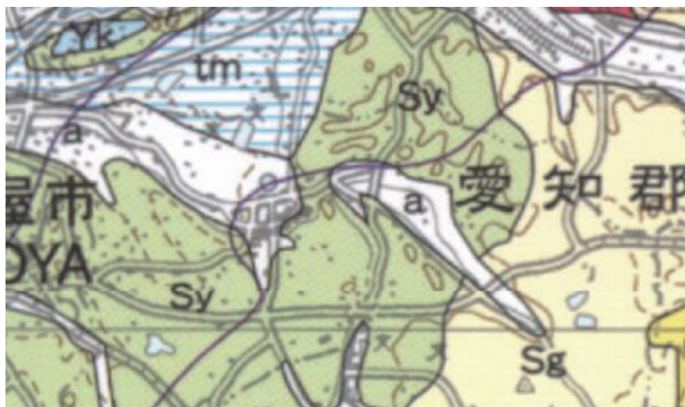
[修正前] 20 万分の 1 地質図幅「豊橋及び伊良湖岬」(牧本ほか, 2004). Ms(砂岩, 泥岩及びメランジ)の分布がありません.

20 万分の 1「豊橋及び伊良湖岬」(牧本 博・山田直利・水野清秀・高田 亮・駒澤正夫・須藤定久, 2004) に, Ms(砂岩, 泥岩及びメランジ)の分布が印刷時に欠落していましたのでお詫びして修正します. なお旧版である 20 万分の 1 地質図幅「豊橋(第 2 版)」(山田直利ほか, 1972)には, 岩作(やざこ)東方に Ps(頁岩・頁岩及びチャート)の分布が描かれていました.